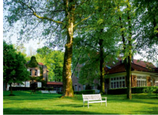
Landhaus Eggert / Münster